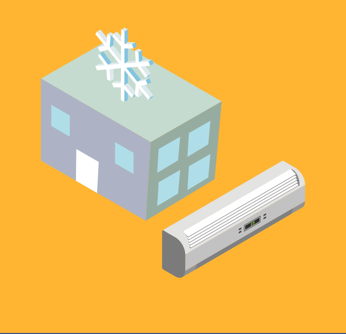
शीतलन केंद्रों को निर्धारित करें