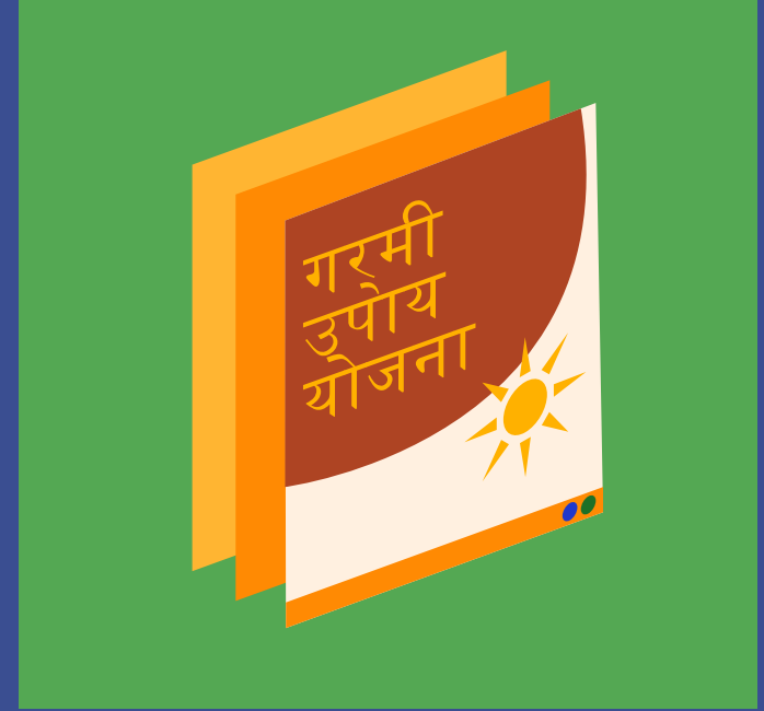
योजनाओं व परियोजनाओं की निगरानी करें