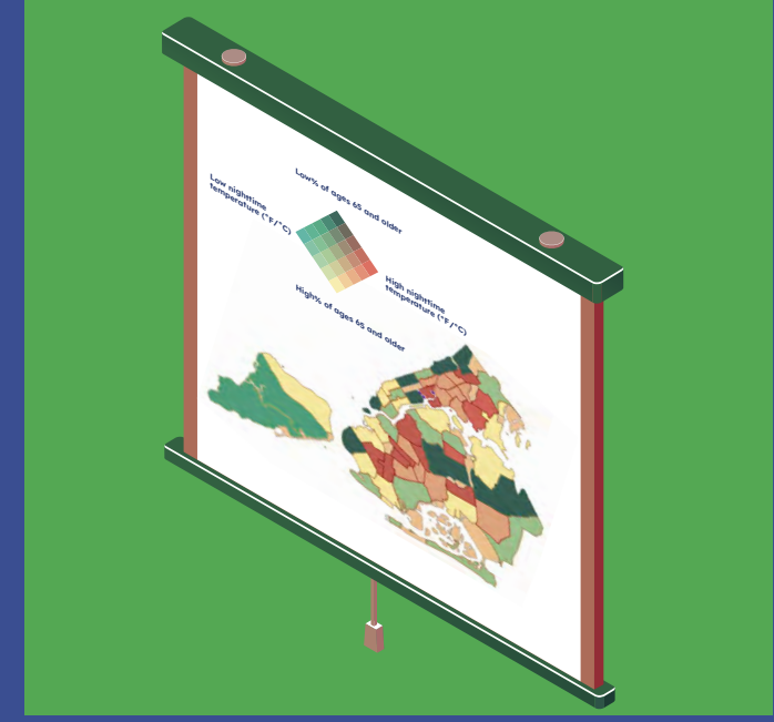
आसपड़ोस से आँकड़े एकत्रित करें