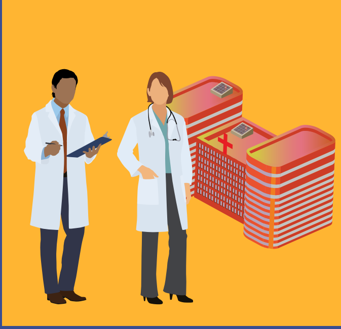
अस्पतालों में स्टाफ बढ़ाएं