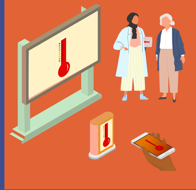
दैनिक तापमान सार्वजनिक करें